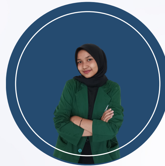
MAYANG PANGEMPYANGNING T.